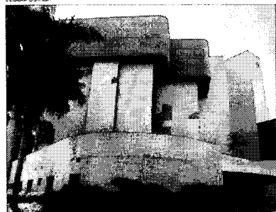
Hospital terá 81 leitos de enfermaria de alta complexidade e 30 UTIs